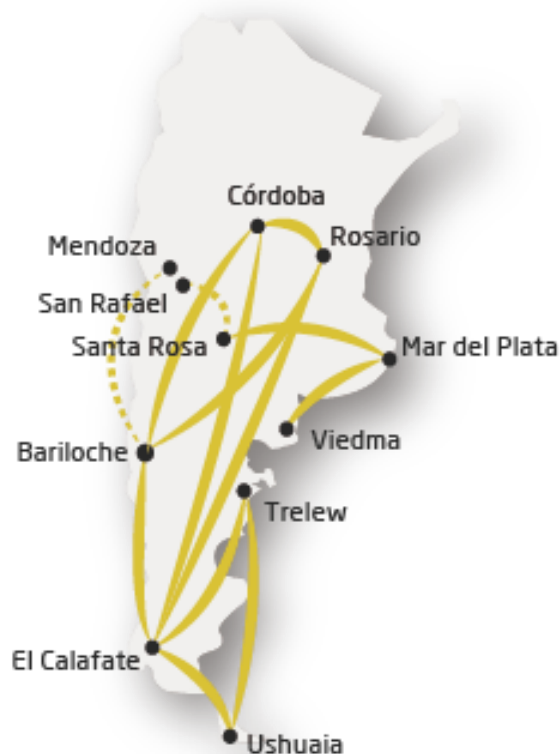
Corredor Federal Sur