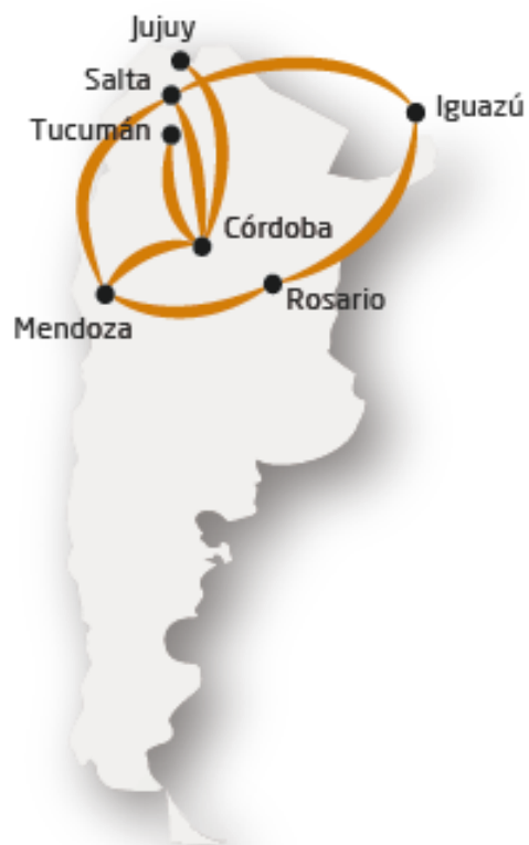
Corredor Federal Norte

Unimos 20 ciudades sin pasar por Buenos Aires