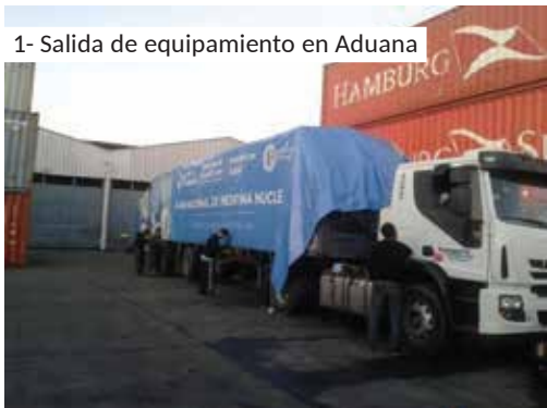
1- Salida de equipamiento en Aduana