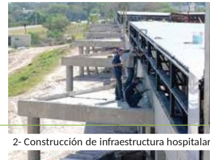
2- Construcción de infraestructura hospitalaria