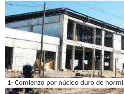
1- Comienzo por núcleo duro de hormigón